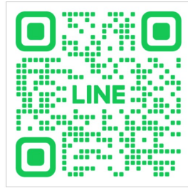
Line 專線QR code